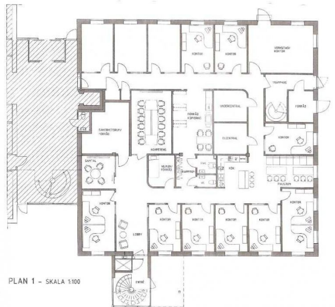
PLAN 1 - SKALA 1:100