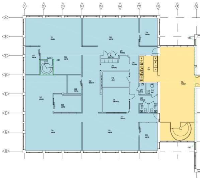
PLAN 2 - Skala 1:100 (A3 1200)