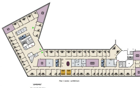
Plan 1, kontor - ca 1690 kvm