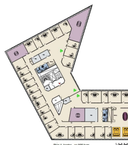
Plan 1, kontor - ca 500 kvm