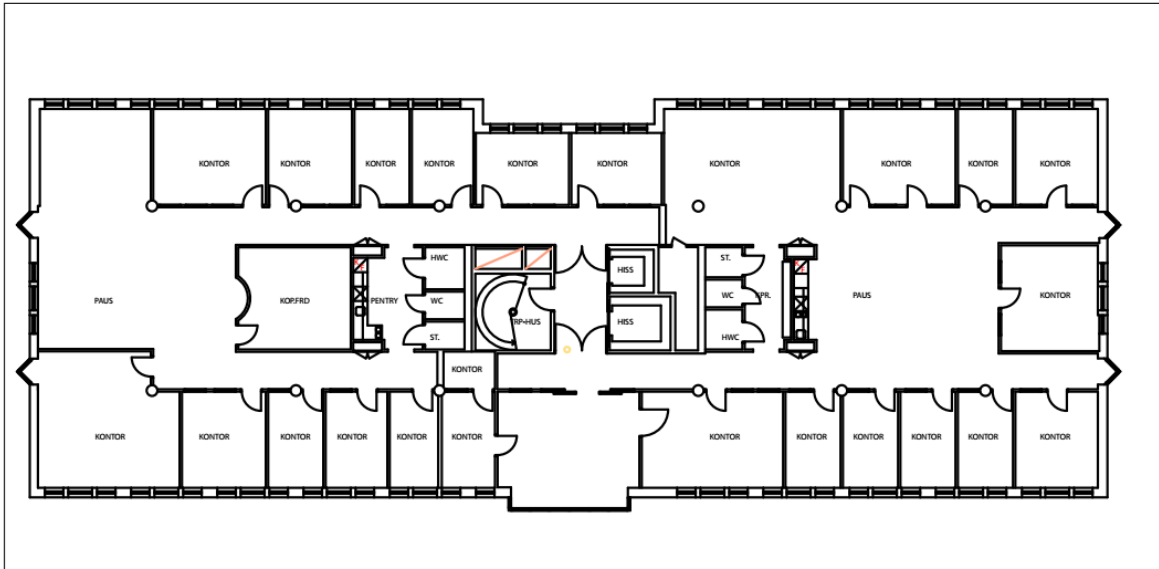
Plan 4 - Vakant 640 kvm