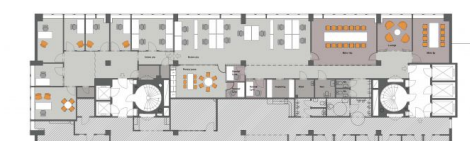
Kv Aprilen 3 - Kontor plan 11, 9 trappor