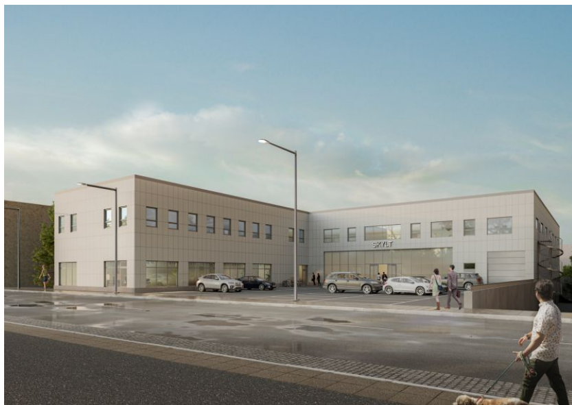
Bågplan 25 Ranhammarsvägen 17-19