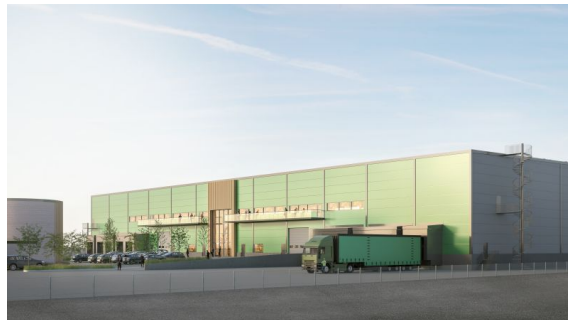
Almnäs etapp 1 Regementsgatan Plan 0(bv)