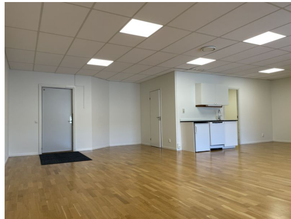
Viby 19:28 Mätarvägen 5 Våning 2